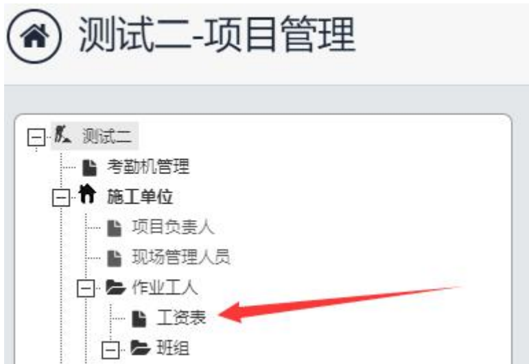
图 2.1.2 项目信息界面