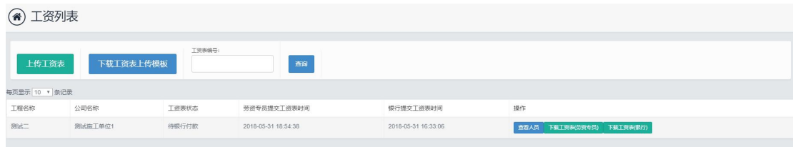
图 1.3.1 工资表记录列表