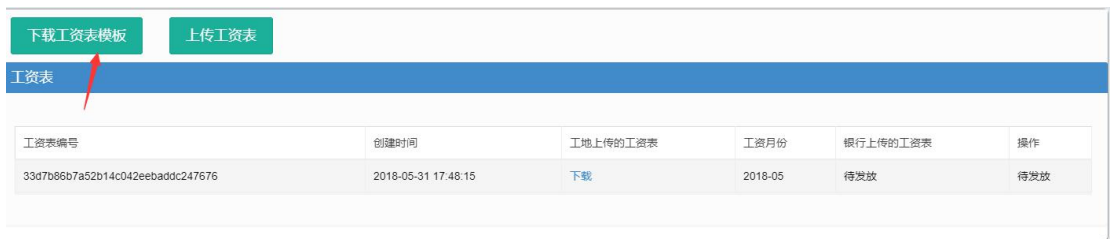
图 2.1.3 工资表记录界面