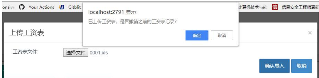
图 2.2.1 工资表上传界面

对工资表进行补充后，点击上传工资表按钮，选择工资表文件进行上传。如果重复上传工资表文件，需确认是否撤销之前提交的数据内容。