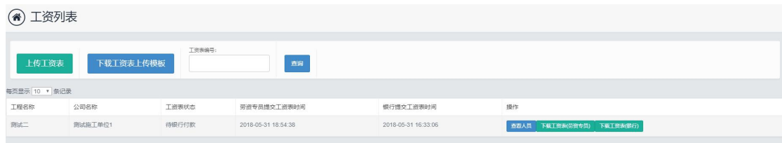
图 1.3.3 工资表记录列表