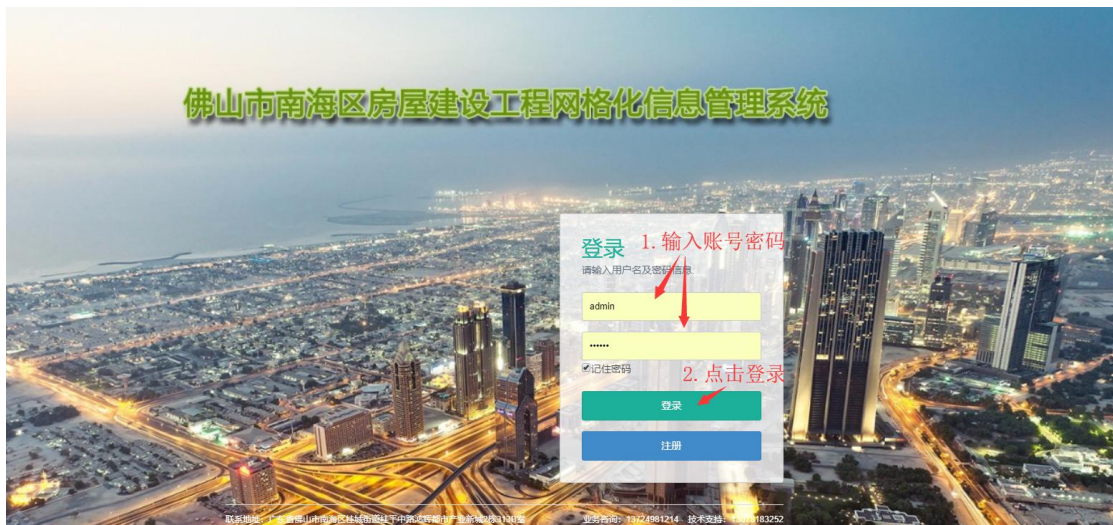
图 1.2.1 系统登录界面